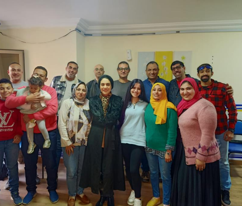
صورة جماعية للخريجين بعد الورشة

العرض، بالإضافة إلى مهارات ضبط الصورة والحركة، وتطوير أفكار تصوير الفيديو.